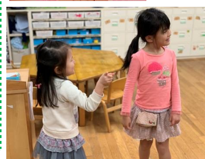
あっち向いてほいっ！！