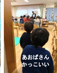
あおばさん かっこいい