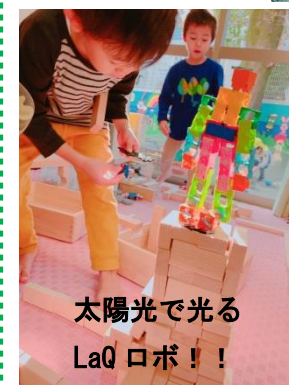
太陽光で光る LaQ ロボ！！