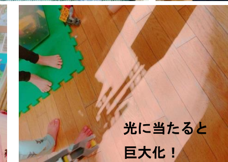
光に当たると 巨大化！