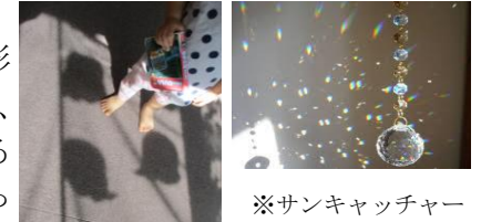
※サンキャッチャー

ふたば組で最近流行っているのは『オバケ』です。オバケに興味を持ったきっかけは、『ねないこだれだ』の絵本です。子ども達はこの絵本が大好きで、オバケの絵が出てくると「オバケ！オバケ！」と言いながら、指をさして嬉しそうに見ています。また、ハンカチを頭に被せてオバケに変身して遊ぶ姿も見られます。保育者が「お～ば～け～だ～ぞ～！」と言いながら、子ども達を驚かせると、「怖い！」と言いながらも笑って逃げたり、友達同士でオバケに変身して見せ合いっこをしたりしています。