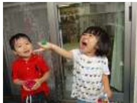
※ふたば組で育てたトマトが実りました！