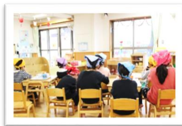
南南東を向いて食べます