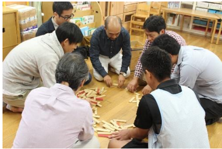
★作戦会議から始めました！